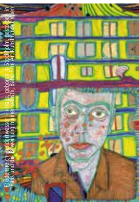
Eigenartig Wunderwasser – Hals, geboren im Stockholmer Gestorbe in Paris und die Bekämpfung ihrer selbst, Baha Fine Art Kunsthandel, Wien

Mit der ART Salzburg Contemporary & Antiques International feiert eine brandneue Kunstmesse ihr Debüt. Das Angebot konzentriert sich in erster Linie auf zeitgenössische Kunst bis zur klassischen Moderne. Darüber hinaus gibt es aber auch ein separates Segment mit erlesenen Antiquitäten.